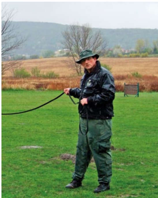
Na položené stopě se záměrně připravovala i rušivá místa