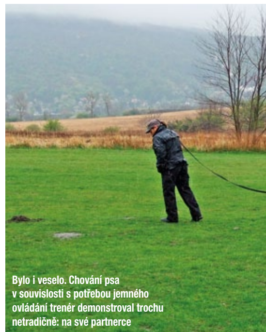
Bylo i veselo. Chování psa v souvislosti s potřebou jemného ovládní trenér demonstroval trochu netradičně: na své partnerce

Je to návštěva, kterou jsem si vždycky přál uskutečnit. Moje rodina, moji dávní předci, po kterých mám i příjmení „Schettler“, pochází z Moravy. Rád bych se dopídl, jestli stále ještě mám někde na Moravě svoje předky nebo příbuzné.